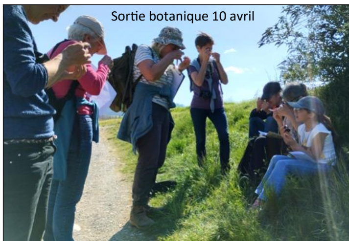
Sortie botanique 10 avril