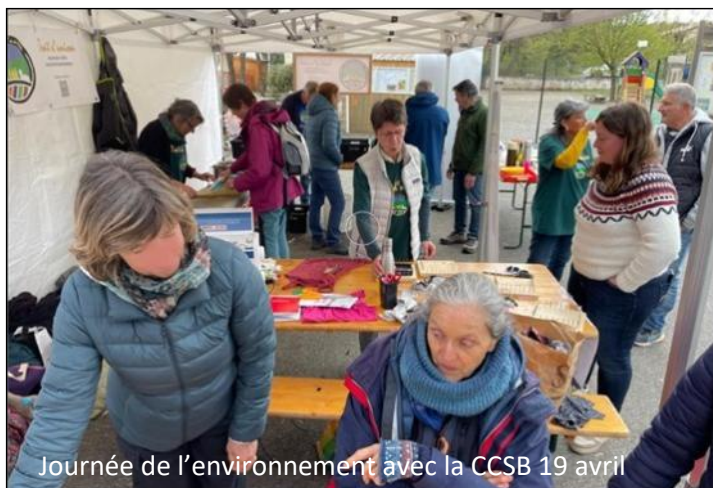
Journée de l'environnement avec la CCSB 19 avril