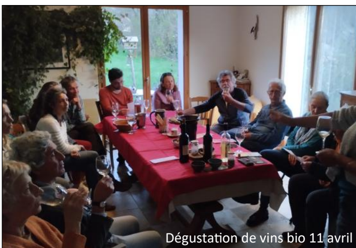
Dégustation de vins bio 11 avril