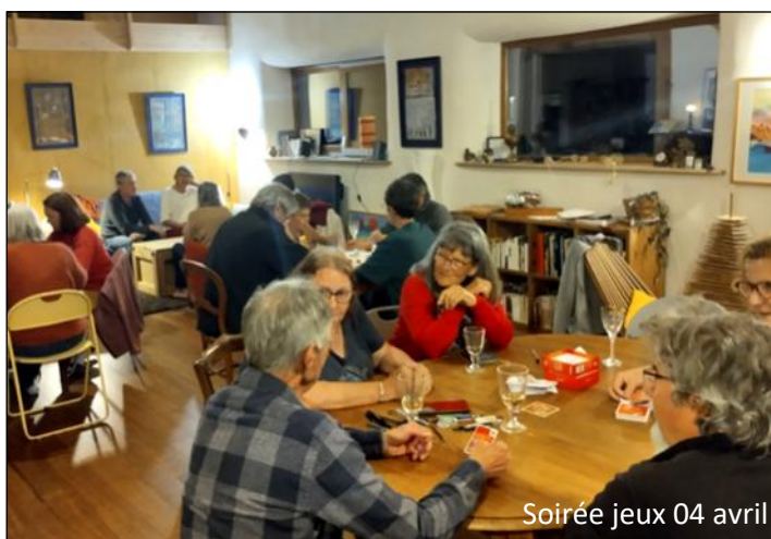
Soirée jeux 04 avril