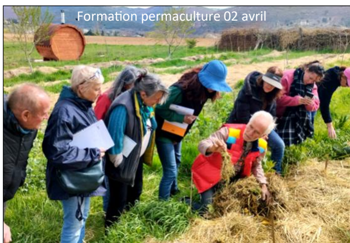
Formation permaculture 02 avril