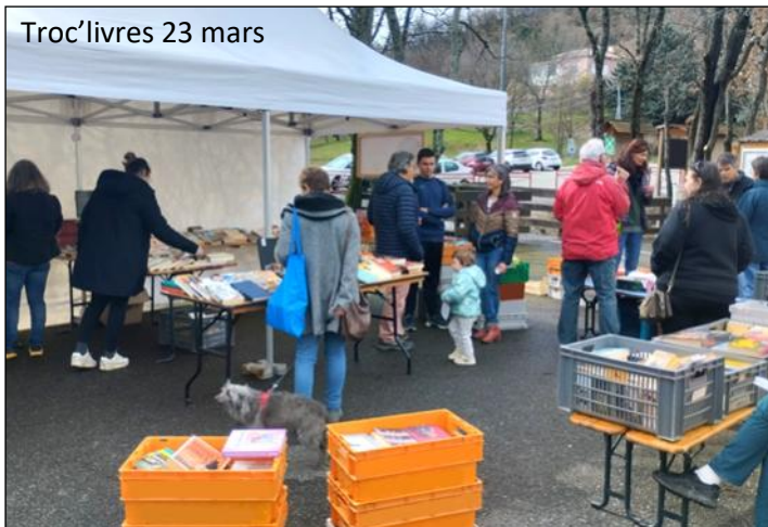
Troc'livres 23 mars