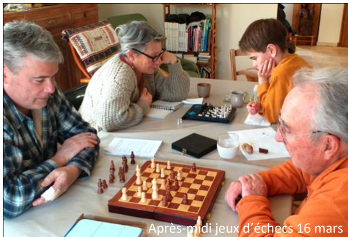
Après-midi jeux d'échecs 16 mars