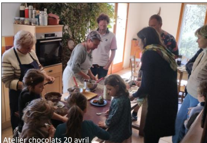
Atelier chocolats 20 avril