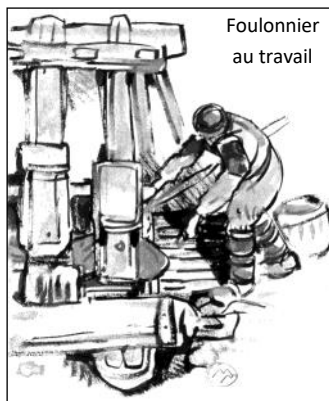
Foulonnier au travail

Brebis et agneaux symbolisent depuis toujours le pays de Sisteron. Parmi les nombreuses exploitations qui découlent du métier de berger, il en était une, aujourd'hui disparue sur le secteur : le moulin à foulon.