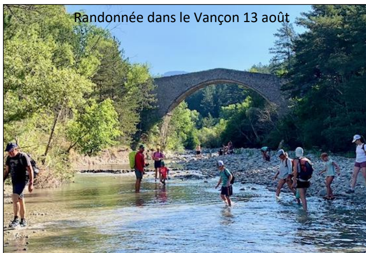
Randonnée dans le Vançon 13 août