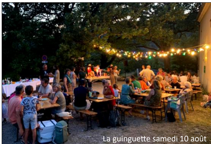
La guinguette samedi 10 août