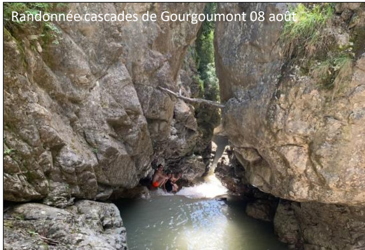
Randonnée cascades de Gourgoumont 08 août