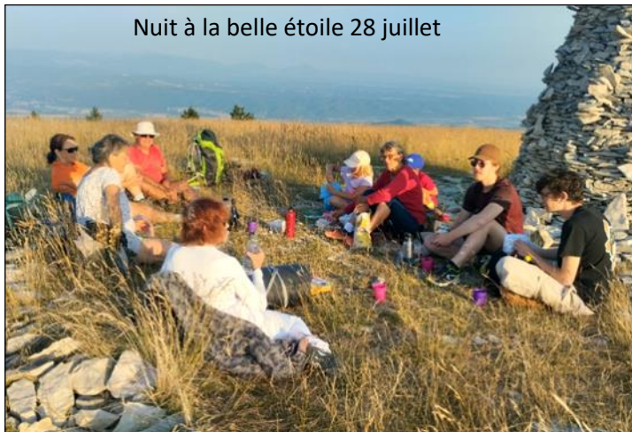
Nuit à la belle étoile 28 juillet