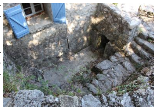
Ancien emplacement de la roue à aubes et canal de sortie sur le bassin de nettoyage.

**contrat entre un propriétaire et un locataire.