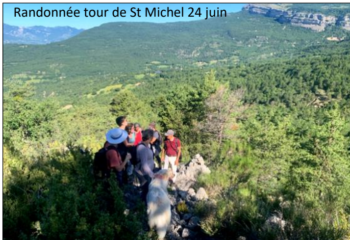
Randonnée tour de St Michel 24 juin