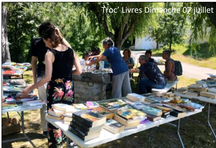
Troc' Livres Dimanche 07 juillet