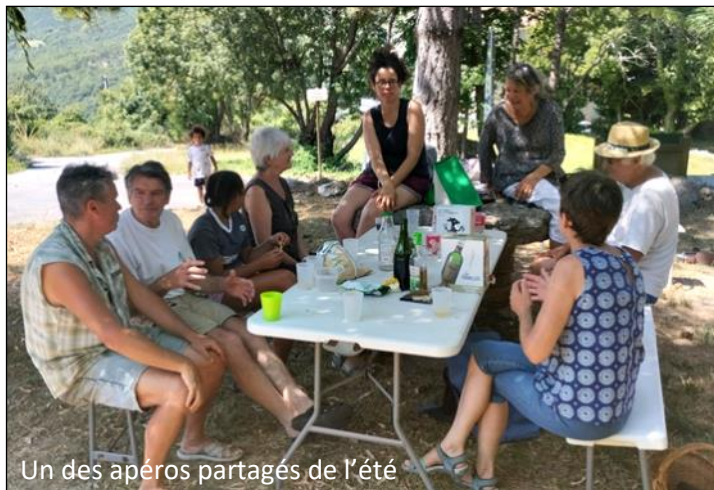
Un des apéros partagés de l'été