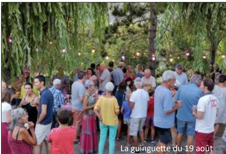
La guinguette du 19 août