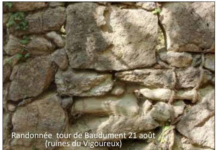
Randonnée tour de Baudument 21 août (ruines du Vigoureux)