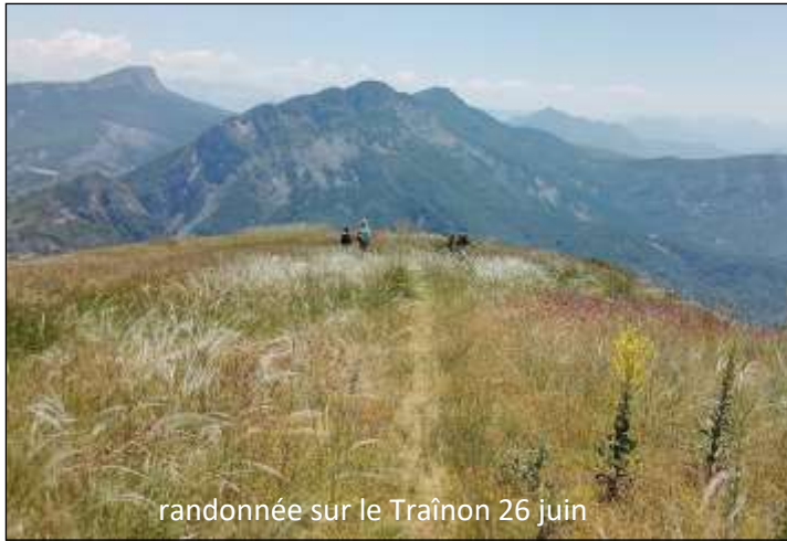
randonnée sur le Traïnon 26 juin