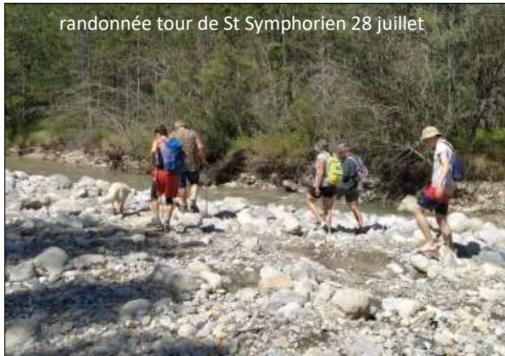
randonnée tour de St Symphorien 28 juillet