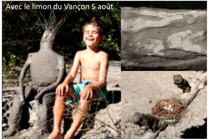
Avec le limon du Vançon 5 août