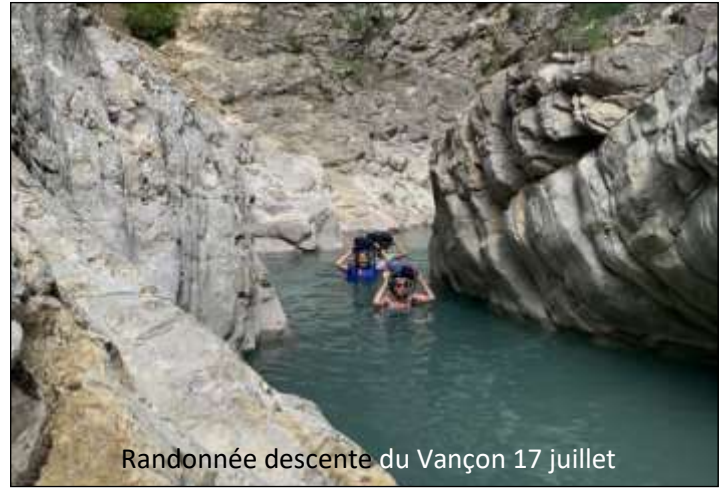
Randonnée descente du Vançon 17 juillet