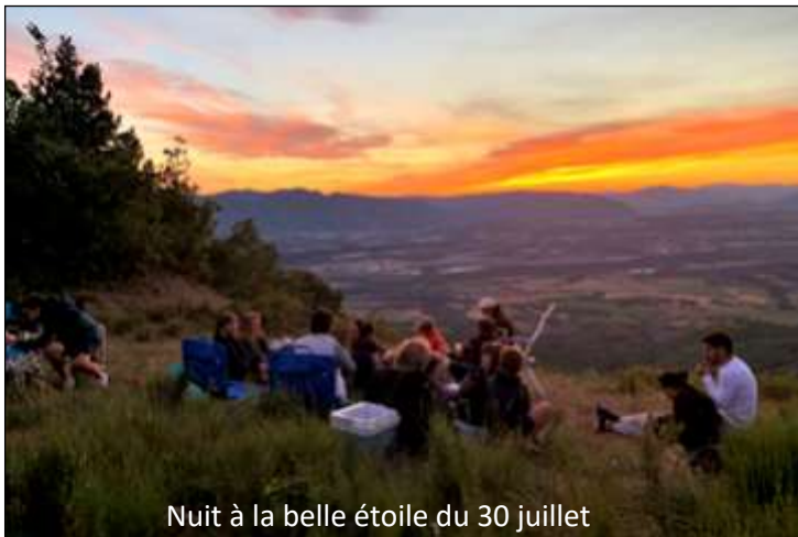
Nuit à la belle étoile du 30 juillet