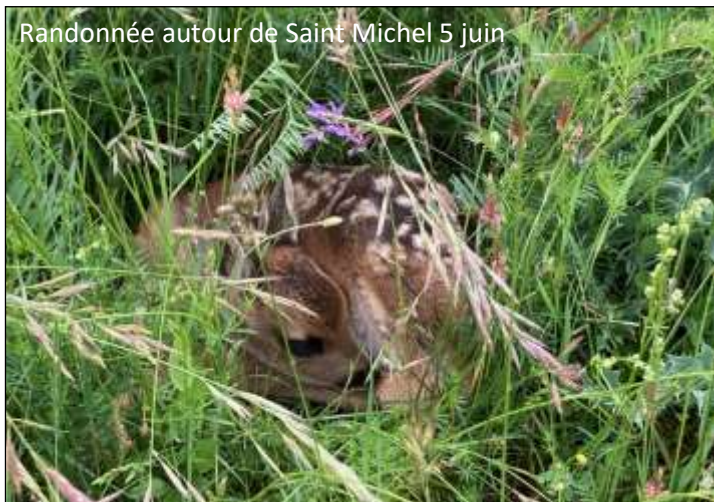
Randonnée autour de Saint Michel 5 juin