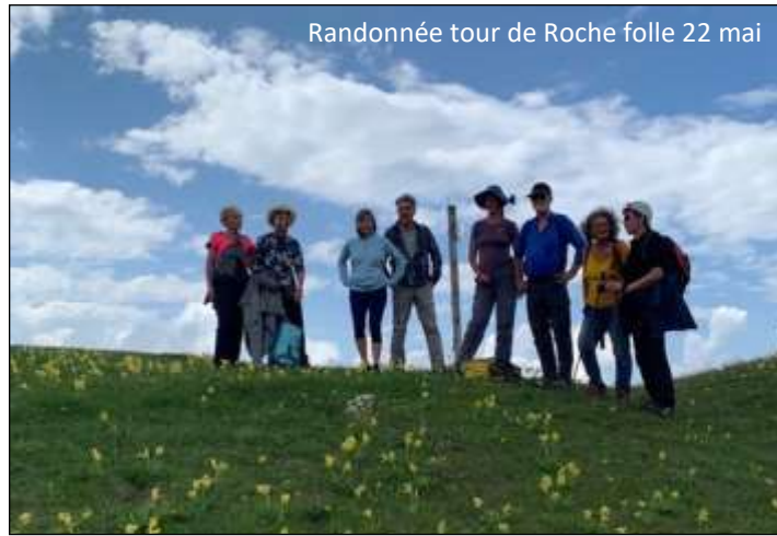
Randonnée tour de Roche folle 22 mai