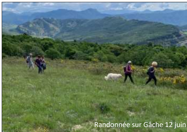
Randonnée sur Gâche 12 juin