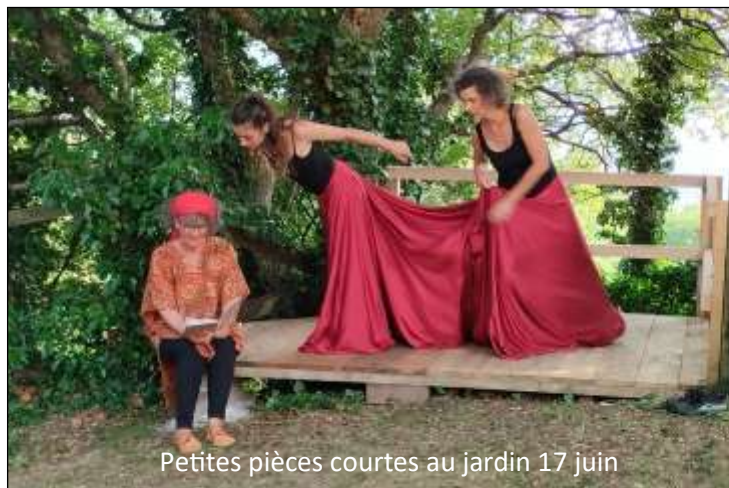
Petites pièces courtes au jardin 17 juin