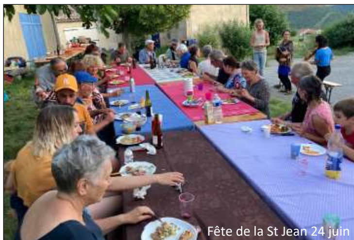
Fête de la St Jean 24 juin