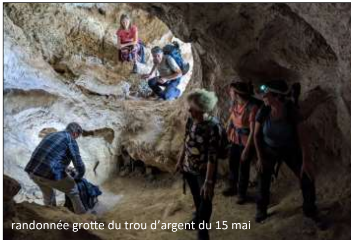
randonnée grotte du trou d'argent du 15 mai