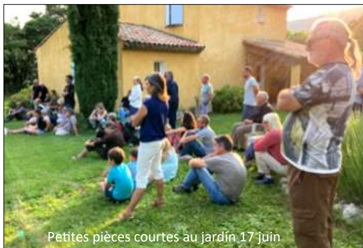
Petites pièces courtes au jardin 17 juin